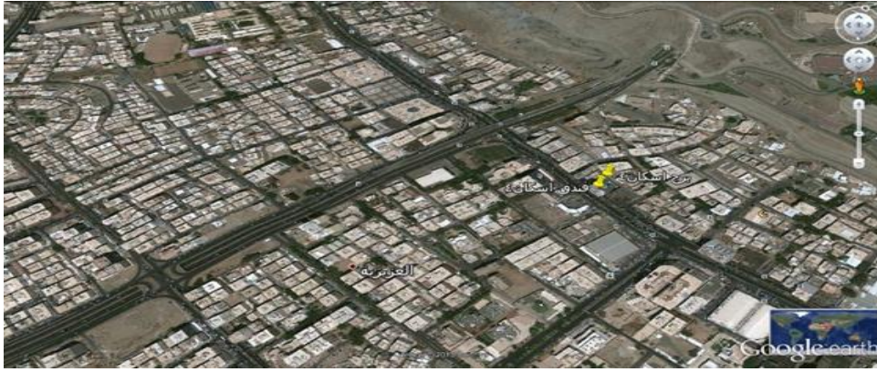
خريطة (1) : موقع برج إسكان 4

يقر مدير الصندوق على وجود تضارب مصالح بين الأطراف التالية بشكل مباشر أو غير مباشر لبرج إسكان 4